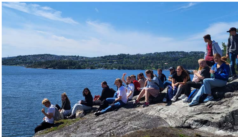
Noch einige Impressionen von der Jugendfreizeit in Norwegen (siehe Seite 10) – weil es so schön war!